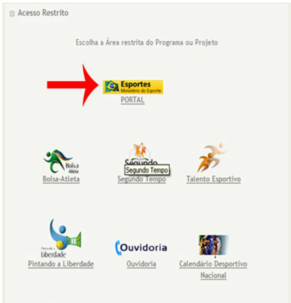
Figura: Acesso Restrito do Portal do Ministério do Esporte

3.2. Na página Acesso Restrito clique no item Portal . A página identificação será visualizada.